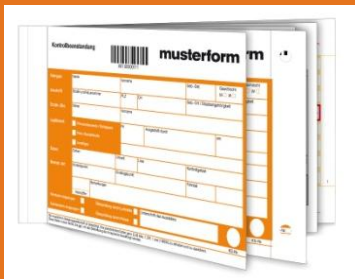
Verwaltungsvordruck mit Barcode

Blatt 3-5 erhält der Fahrgast. Das Gegenstück zum Barcode auf Blatt 1 ist der 2D-Code auf Blatt 3. Dieser Code kann von Ticket-Automaten eingescannt werden und ermöglicht das bequeme und sichere Zahlen am Ticketautomaten. Alternativ ist in den Verwaltungsvordruck noch ein Überweisungsträger integriert. Er ermöglicht dem Kunden das Zahlen auf herkömmliche Weise.