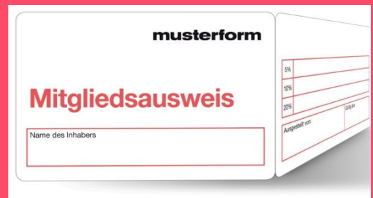
Zusammenkleben der Faltkarte