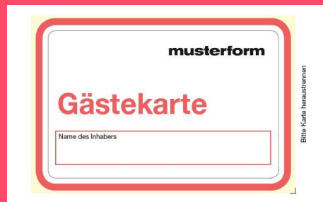
Karte zum Durchdrücken